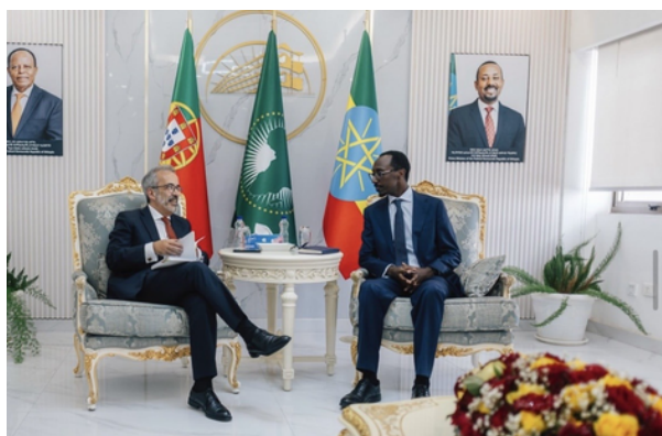
Encontro entre Paulo Rangel (à esquerda) com o homólogo etíope, Gideon Timothewos (à direita)

Já no Quênia, Paulo Rangel manteve reuniões oficiais em Nairobi com o Presidente William Ruto e o homólogo queniano, Hon Mudavadi Os encontros centraram-se no reforço das relações bilaterais, com destaque para a cooperação económica em setores como energias renováveis, agricultura, economia azul e formação técnica. Foi igualmente abordada a cooperação em fóruns multilaterais, nomeadamente nas Nações Unidas, bem como o interesse em reforçar a presença empresarial portuguesa na região.