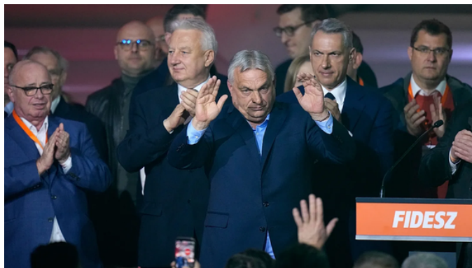
Derrota de Orbán, após 16 anos de governação

Inicialmente identificado como um ferrenho anticomunista, no período pós-transição democrática, aquando das primeiras eleições democráticas na Hungria em 1990, Orbán evoluiu para posições mais conservadoras e nacionalistas. Durante o seu mandato, o mesmo adotou alterações institucionais, incluindo a revisão da Constituição e fazendo aprovar leis, com o objetivo de criar uma “democracia cristã iliberal” (que por si só apresenta-se como uma contradição, já que uma democracia não poderá constituir-se enquanto iliberal). Restringiu a liberdade de imprensa, adotou medidas antimigração, e limitou direitos das minorias, nomeadamente, da comunidade LGBTQIA+. Esta atuação de Orbán gerou atritos com a União Europeia, que chegou mesmo a suspender bilhões de euros ao país devido a violações de padrões democráticos e do Estado de direito.