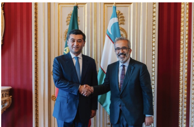
Paulo Rangel (direita) com o seu homólogo do Uzbequistão (esquerda)

No dia 9 de abril, o Ministro dos Negócios Estrangeiros, recebeu em Lisboa o Ministro dos Negócios Estrangeiros do Uzbequistão, Bakhtiyor Saidov, no Palácio das Necessidades. O encontro centrou-se no reforço do diálogo político e na identificação de oportunidades de cooperação económica, nomeadamente nos setores dos transportes, energia e conectividade, bem como no aprofundamento das relações entre a Ásia Central e a União Europeia.