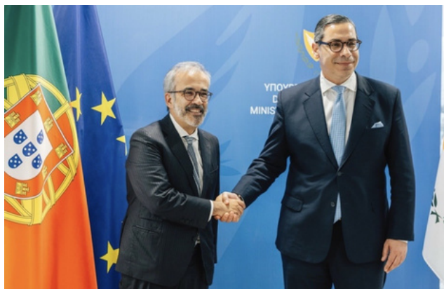
Paulo Rangel (à esquerda) e Constantinos Kombos (à direita)

No mesmo dia deslocou-se ainda a Beirute, onde manteve reuniões com o seu homólogo libanês, Youssef Raggi, e com representantes das Nações Unidas no terreno. A visita centrou-se na análise da situação política e económica do país, bem como no impacto da crise regional na estabilidade libanesa. Foi ainda discutido o apoio internacional ao Líbano e a importância das missões de manutenção de paz da ONU na região.