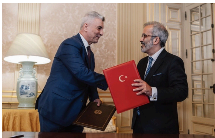
Celebração de acordos entre o MNE turco (à esquerda) e português (à direita)

No mesmo dia, o Ministro dos Negócios Estrangeiros da Turquia, Ömer Bolat, foi recebido em Lisboa pelo seu homólogo português, tendo sido reforçado o diálogo político e económico entre os dois países, bem como a cooperação no contexto internacional e no quadro da NATO.