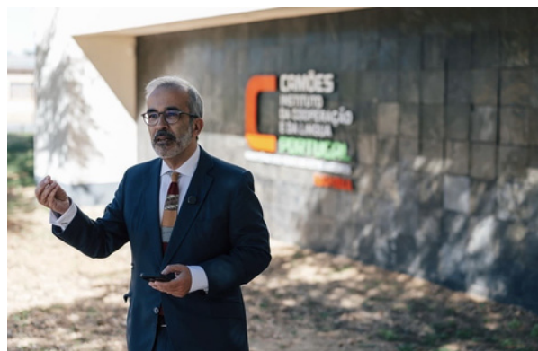
Visita de Rangel ao centro de ensino de português Diogo Cão, na Namíbia