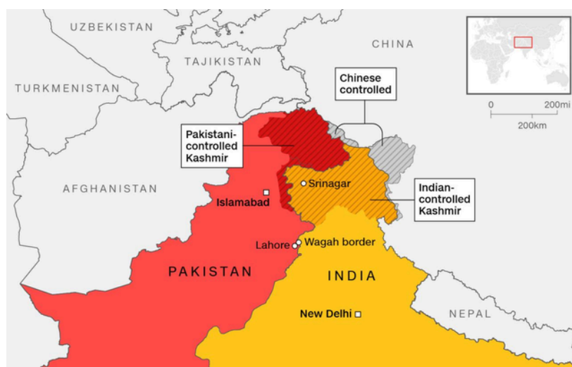
Região da Caxemira (riscas) com território sob controle indiano (amarelo) e paquistanês (vermelho) realçado

O conflito de Caxemira é uma disputa territorial entre a Índia e o Paquistão sobre o território da Caxemira, localizada no noroeste do subcontinente indiano, que decorre desde 1947. Adicionalmente, uma disputa territorial entre a China e a Índia sobre o território de Aksai Chin no norte da Caxemira decorre desde 1959.