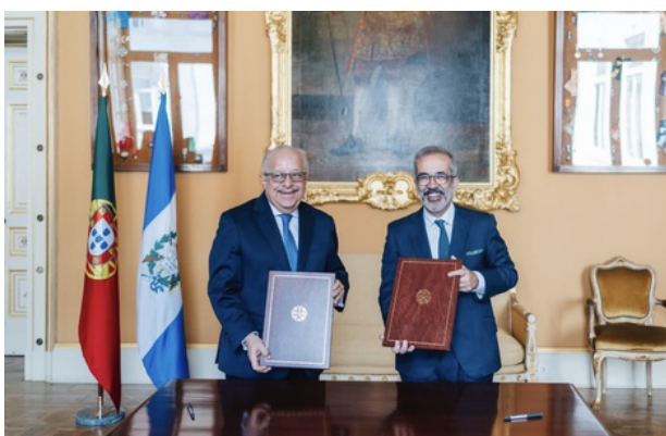
Assinatura de acordos entre Portugal e a Guatemala

Com o seu homólogo da Jordânia, Ayman Safadi, esteve na agenda as relações entre os dois países nas áreas do comércio e economia, bem como a situação geopolítica de ambos os continentes.