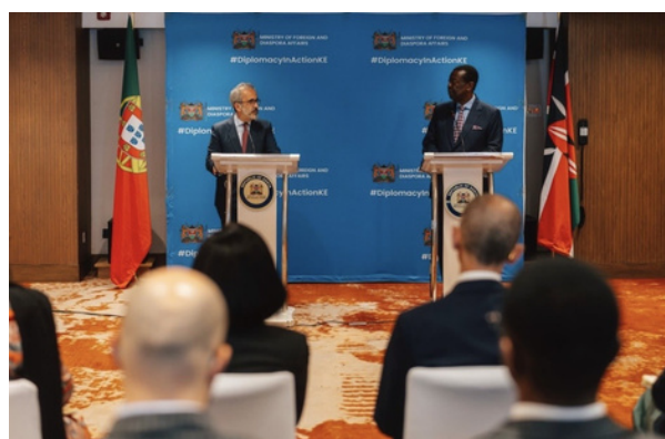
Conferência de imprensa com Paulo Rangel (à esquerda) e o MNE queniano Hon Mudavadi (à direita)