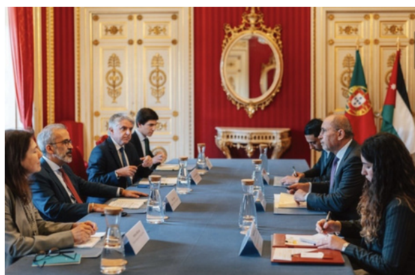
Reunião entre Paulo Rangel e o seu homólogo da Jordânia