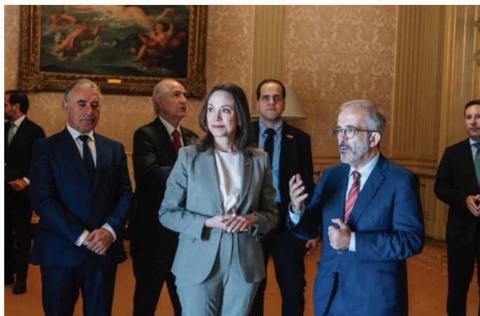
Paulo Rangel (à esquerda) e Corina Machado (à direita)

No dia seguinte, a 22 de abril de 2026, Paulo Rangel recebeu Corina Machado, líder da oposição venezuelana e vencedora do Prémio Nobel da Paz e Prémio Sakharov. Foi discutido o compromisso de Portugal com o processo de transição para a democracia no país, bem como a situação dos presos políticos e da comunidade luso-venezuelana.