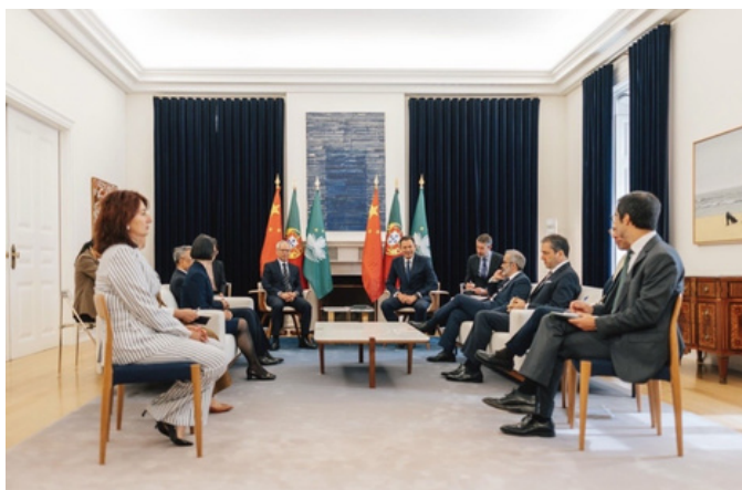
Reunião entre o Primeiro-Ministro, Luís Montenegro, e Sam Hou Fai

A 21 de abril, o Chefe do Executivo da Região Administrativa Especial de Macau, Sam Hou Fai, foi recebido no Ministério dos Negócios Estrangeiros e em audiência oficial com o Ministro e Primeiro-Ministro português. A reunião centrou-se no reforço da cooperação entre Portugal e Macau, incluindo relações económicas, educação superior e cooperação jurídica. Foi também analisado o papel de Macau como plataforma de ligação entre a China e os países de língua portuguesa no âmbito do Fórum Macau. A visita incluiu ainda contactos com entidades empresariais e institucionais ligadas à cooperação sino-lusófona.