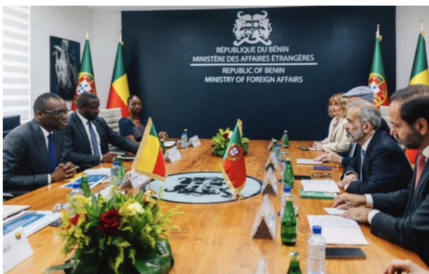
Reunião entre as delegações de Portugal e do governo do Benim