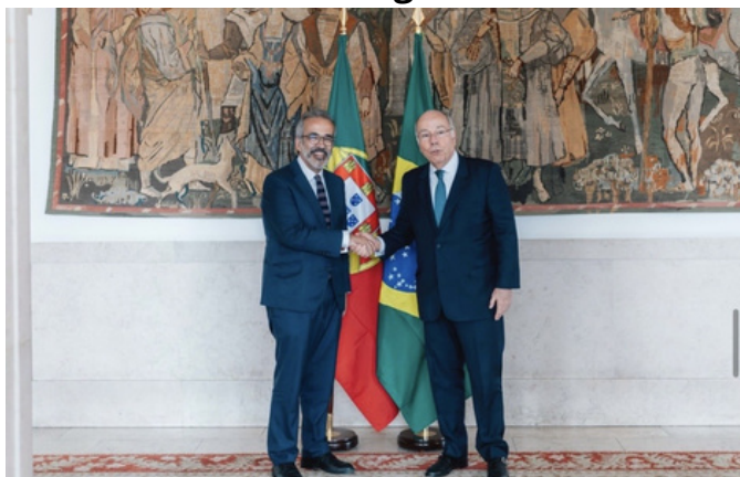
Paulo Rangel (à esquerda) e Mauro Vieira (à direita)

Ainda no dia 21 de abril de 2026, o Ministro dos Negócios Estrangeiros do Brasil, Mauro Vieira, foi recebido no Palácio das Necessidades pelo seu homólogo português. A reunião incidiu no reforço da relação estratégica bilateral, na cooperação no espaço da CPLP e na coordenação em fóruns multilaterais como as Nações Unidas e o G20, bem como no aprofundamento das relações económicas e culturais.