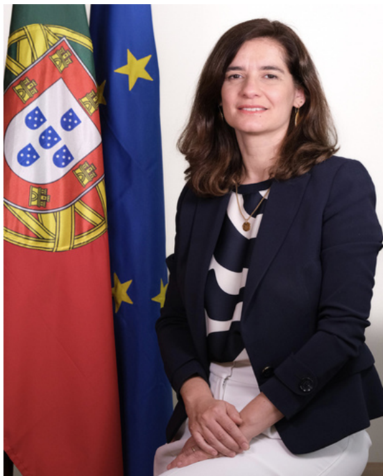
Dra. Inês Domingos

A nossa entrevistada deste mês é a Doutora Inês Domingos, atual Secretária de Estado dos Assuntos Europeus. Licenciada e Mestre em Economia, Inês Domingos iniciou a sua carreira enquanto economista na City de Londres, tendo depois sido investigadora na Universidade Católica Portuguesa. Entre 2015 e 2019, exerceu funções de deputada à Assembleia da República e, entre 2021 e 2024, assumiu o cargo de consultora económica do Presidente da República.