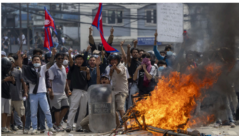
Protestos da “Geração Z” em setembro de 2025

Os confrontos entre manifestantes e forças de segurança resultaram em pelo menos 77 mortos. A mobilização da chamada “Geração Z” revelou uma capacidade inédita de organização e comunicação política nas plataformas digitais, um contexto que abriu caminho à queda do governo e à formação de um executivo interino, criando as condições para a vitória eleitoral do RSP.