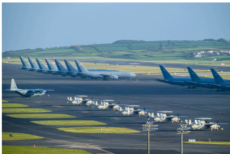
Presença americana na Base das Lajes intensificada

Neste contexto, é importante analisar também o papel de países que, não sendo diretamente envolvidos, acabam por integrar a estrutura que sustenta estas dinâmicas. Portugal constitui um exemplo claro dessa realidade. O aumento da presença militar norte-americana na Base das Lajes, nos Açores, demonstra a importância estratégica do território português no quadro da NATO. Este facto evidencia como o país, ainda que de forma indireta, se encontra ligado à evolução do conflito e às dinâmicas de segurança internacional.