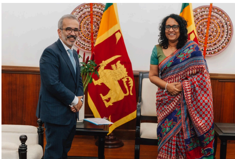
O Ministro dos Negócios Estrangeiros, Paulo Rangel (esquerda), com a Primeira-Ministra do Sri Lanka Harini Amarasuriya (direita)

De seguida, Rangel encontrou-se com a Primeira-Ministra do Sri Lanka, Harini Amarasuriya, visitando mais tarde o Porto de Colombo, a Igreja de Santo António em Kochichikade, o Museu Nacional de Colombo e, por fim, o Templo Gangarama.