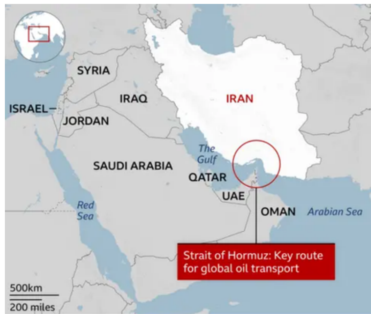
Bloqueio de Ormuz

A par disso, a ameaça de ataques a infraestruturas económicas reforça a perceção de que o conflito poderá assumir uma dimensão mais alargada. Este tipo de discurso evidencia uma lógica de dissuasão, mas também revela o potencial de escalada caso a situação se agrave. Neste sentido, o conflito no Irão deixa de ser apenas uma questão regional, passando a integrar um conjunto mais vasto de tensões que caracterizam o sistema internacional atual.