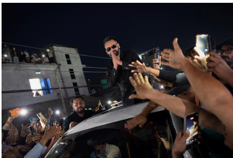
Balendra Shah festeja a vitória nas eleições

Os resultados foram oficialmente anunciados na quinta-feira dia 12 de março pela Comissão Eleitoral. Segundo o antigo presidente do organismo, Bhoj Paj Pokharel, citado pelo jornal local Kantipur, este resultado representou uma “erupção da frustração pública há muito reprimida” e atribuiu o colapso dos líderes no poder há décadas a um “jogo de cadeiras” no poder.