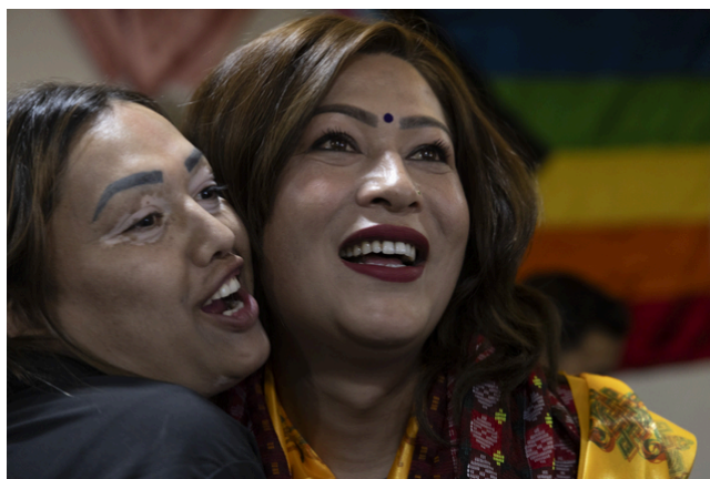
Deputada Bhumika Shrestha, primeira mulher trans no parlamento nepalês

Este resultado indica uma mudança no perfil do poder político nepalês, não apenas geracional, mas também social, refletindo uma maior abertura à inclusão e pluralidade. Ainda assim, o grande obstáculo que o novo governo enfrenta é o de traduzir estas conquistas simbólicas em políticas públicas concretas, capazes de responder às expectativas do povo nepalês.