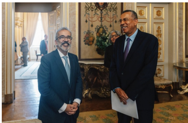
Paulo Rangel (à esquerda) e José Livramento de Brito (à direita)

No dia 13 de março, Paulo Rangel reuniu com o seu homólogo cabo-verdiano, José Livramento de Brito, no Palácio das Necessidades, em Lisboa. Neste encontro foram destacadas as áreas de atuação comum, como o clima, a educação e a energia, para além da afirmação da cooperação dos dois países na CPLP e respetivas organizações regionais, como a UE e a UA.