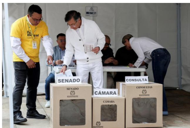
Gustavo Petro, presidente da Colômbia (centro), vota nas eleições legislativas do país

No plano internacional, houve tensões com os Estados Unidos motivadas pela captura do ditador venezuelano Nicolás Maduro, imposição de sanções por parte de Washington ao Presidente Petro e, por fim, as ameaças de tarifas comerciais.