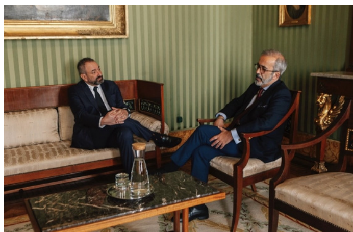
Paulo Rangel (à direita) e Luca Beccari (à esquerda)

Dois dias depois (25 de março), o Ministro reuniu com outro seu homólogo, desta vez de São Marino, Luca Beccari. Naquela que foi a primeira visita oficial do ministro do microestado a Portugal, ambos os ministros destacaram na sua conversa o reforço da cooperação entre os dois Estados, nomeadamente na área da digitalização, o acordo de associação de São Marino com a UE e a atual situação geopolítica no mundo.