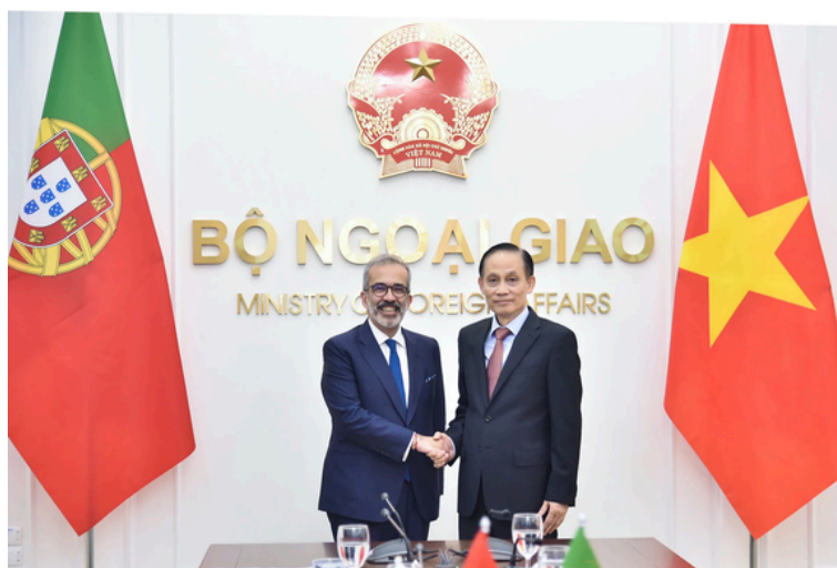
O Ministro dos Negócios Estrangeiros, Paulo Rangel (esquerda), com o seu homólogo do Vietname, Le Hoai Trung (direita)

O Ministro também mencionou a possibilidade da reabertura das embaixadas de Portugal nas Filipinas e na Malásia, sustentando que “isso permitiria concluir uma cobertura totalmente diferente de economias altamente dinâmicas da Ásia”, enfatizando estes laços como prioritários “numa altura em que falamos de multilateralismo e dos riscos que ele corre”. Rangel sugeriu também a possibilidade da abertura de um escritório consular no Nepal, que abriu uma embaixada em Lisboa.