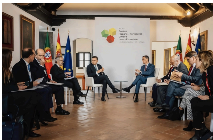
Reunião entre as delegações portuguesa (à esquerda) e espanhola (à direita)

Para além do Primeiro-Ministro, Luís Montenegro, e do MNE, Paulo Rangel, a delegação portuguesa contou ainda com o Ministro da Economia e Coesão Territorial, o Ministro Adjunto e da Reforma do Estado, o Ministro da Administração Interna, a Ministra da Saúde, a Ministra do Trabalho e a Ministra do Ambiente e Energia, evidenciando o carácter multissetorial desta cimeira.