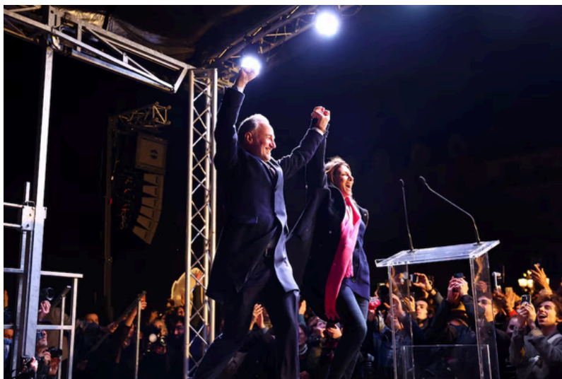
A atual Presidente da Câmara de Paris, Anne Hidalgo, e Emmanuel Grégoire, candidato socialista à presidência da Câmara de Paris, reagem aos resultados preliminares que indicaram vitória Emmanuel Grégoire no segundo turno das eleições

No total, foram eleitos candidatos para ambos os cargos municipais da presidência das câmaras e os membros dos conselhos, sendo estes responsáveis em conjunto pela governação e, respetivamente, a representação dos seus eleitores a nível local. Ainda que, essencialmente, estas eleições tenham um carácter, geograficamente, limitado aos municípios, por ocorrem em paralelo a diversas mudanças no paradigma político nacional, acabaram por ter um peso de maior dimensão na esfera pública, tendo, também, um propósito secundário ao servir como um indicador indireto do equilíbrio da força entre os diferentes blocos políticos franceses, a pouco mais de um ano das eleições presidenciais de 2027.