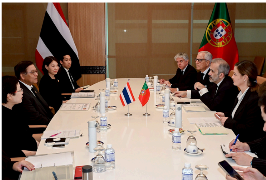
A delegação diplomática portuguesa, liderada pelo Ministro dos Negócios Estrangeiros Paulo Rangel (centro à direita), encontra-se com o Ministro dos Negócios Estrangeiros da Tailândia, Sihasak Phuangkitkeow (centro à esquerda)

Após esta conferência, o Ministro português deu uma palestra relativamente à perspetiva de Portugal numa série de questões multilaterais, o seu papel a nível global, e as suas relações com a Tailândia.