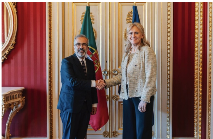
Paulo Rangel (à esquerda) e Porgerdur Katrín Gunnarsdóttir (à direita)

A 23 de março, o MNE recebeu, no Palácio das Necessidades, a sua homóloga da Islândia, Porgerdur Katrín Gunnarsdóttir. Alguns dos temas discutidos foram o aprofundamento das relações bilaterais Portugal-Islândia, os laços transatlânticos e a NATO, e o Ártico. Nesta visita, a ministra islandesa apontou que a entrada do seu país na União Europeia é do interesse de todos os islandeses, dado que um referendo sobre a adesão da Islândia vai ser alvo de um referendo em Agosto deste ano.