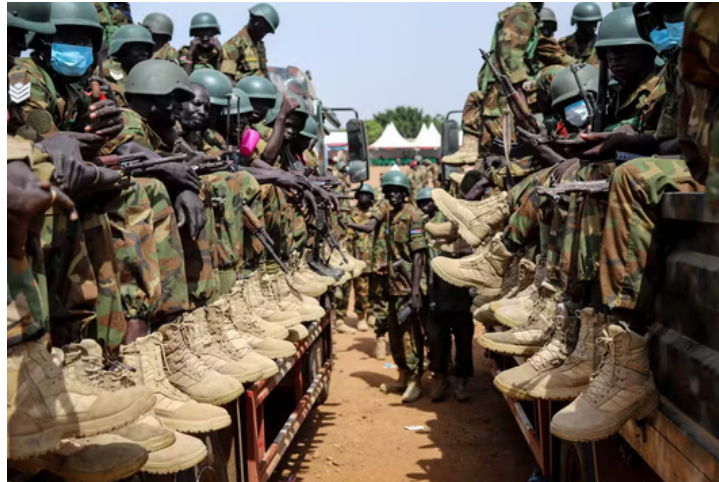
Soldados sudaneses

Num cenário internacional já marcado por múltiplas crises, a situação no Sudão do Sul constitui um teste crítico à eficácia dos esforços de construção da paz e à capacidade da comunidade internacional em prevenir conflitos. A escalada atual representa, assim, não apenas um desafio interno, mas também uma preocupação crescente para a segurança e estabilidade globais.