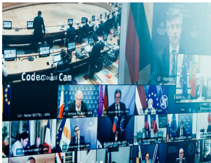
Reunião do Conselho de Negócios Estrangeiros

Os trabalhos centraram-se, em grande medida, na guerra na Ucrânia, que continua a dominar a agenda externa da União. Os Estados-Membros reiteraram o compromisso com o apoio político, financeiro e militar a Kyiv, sublinhando que “a Ucrânia continua a ser a principal prioridade da Europa em matéria de segurança” . Neste contexto, foi reforçada a continuidade das sanções à Rússia e a necessidade de limitar as suas fontes de financiamento. Também a situação no Médio Oriente teve um lugar de destaque na reunião, abordando os riscos de escalada regional e os seus impactos nas cadeias de abastecimento e nos mercados energéticos. Os ministros apelaram à contenção e ao regresso à via diplomática, enfatizando a importância de salvaguardar a estabilidade internacional e a liberdade de navegação em rotas estratégicas.