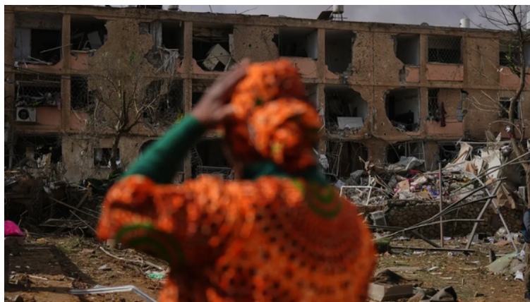
Bombardeamentos de Israel ao Irão

É precisamente neste ponto que se verifica uma mudança relevante na natureza do conflito. A evolução dos acontecimentos internos começou a refletir-se no plano internacional, dando origem a um aumento das tensões entre o Irão e outros atores, em particular os Estados Unidos da América e Israel. O agravamento destas relações marcou um ponto de viragem, transformando a crise iraniana num elemento de instabilidade com impacto global.